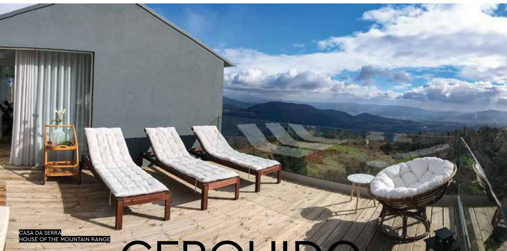
CASA DA SERRA HOUSE OF THE MOUNTAIN RANGE