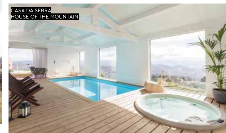
CASA DA SERRA HOUSE OF THE MOUNTAIN

fim da viagem, daqui serão levadas recordações excepcionais para toda a vida.