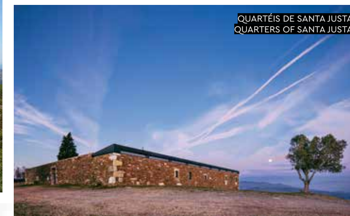
QUARTÉIS DE SANTA JUSTA QUARTERS OF SANTA JUSTA