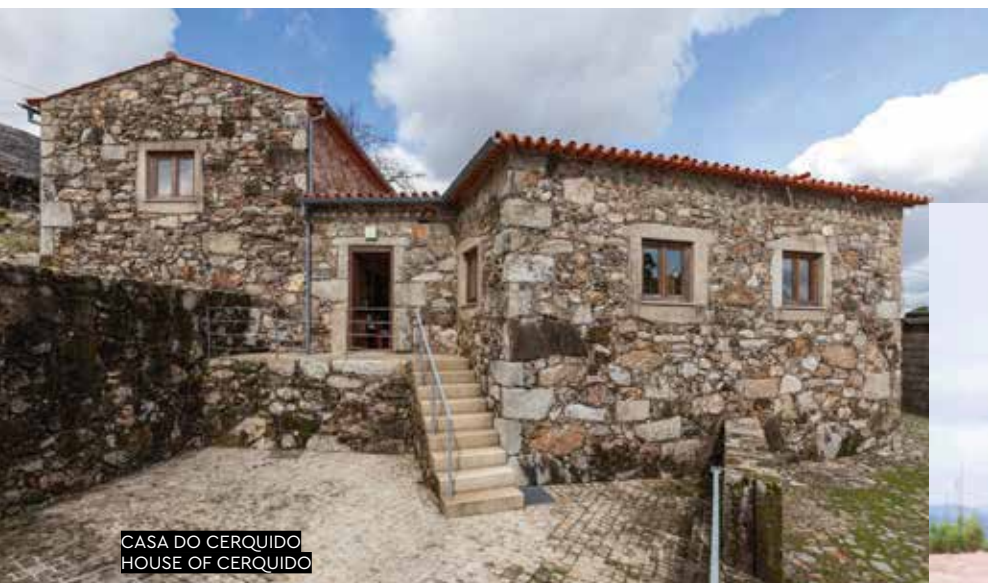
CASA DO CERQUIDO HOUSE OF CERQUIDO