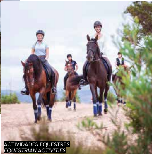
ATIVIDADES EQUESTRES EQUESTRIAN ACTIVITIES

Crie os seus próprios segredos, mas não esconda este. O Cerquido Village é o único que não é para guardar! //